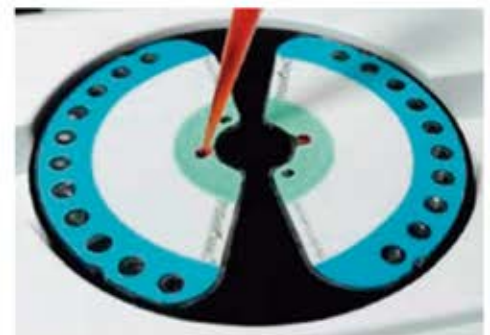
Paso 2 Añada la muestra y diluya