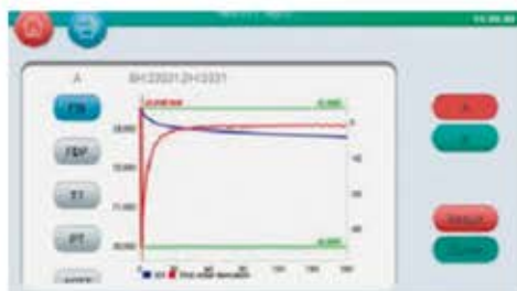
Paso 3 Haga clic en "inicio"