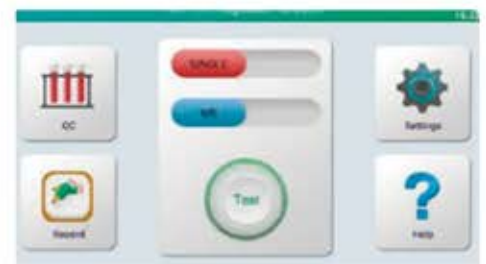
Paso 4 Lectura de Resultados